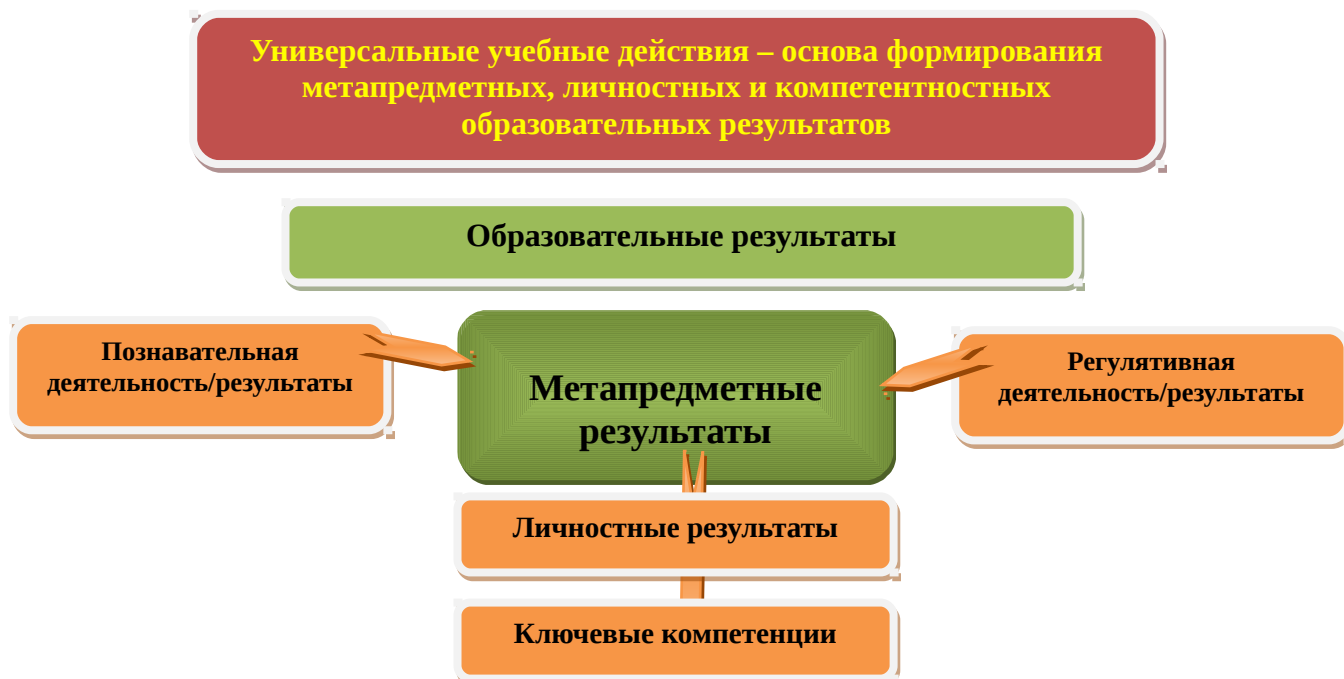
Рис. 3. Система оценки образовательных результатов

Интерпретация результатов оценки ведётся на основе контекстной информации об условиях и особенностях деятельности субъектов образовательного процесса. В частности, итоговая оценка обучающихся определяется с учётом их стартового уровня и динамики образовательных достижений.