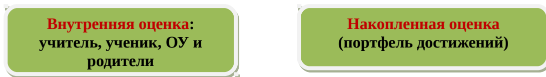
Рис. 2. Система оценки достижения планируемых результатов

В соответствии с ФГОС ООО основным объектом системы оценки результатов образования, её содержательной и критериальной базой выступают требования Стандарта , которые конкретизируются в планируемых результатах освоения обучающимися основной образовательной программы основного общего образования.